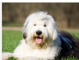
Old English Sheepdog